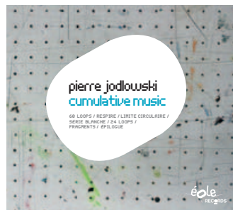
Pierre Jodlowski : cumulative music réf : éOr_001 / sortie septembre 2011