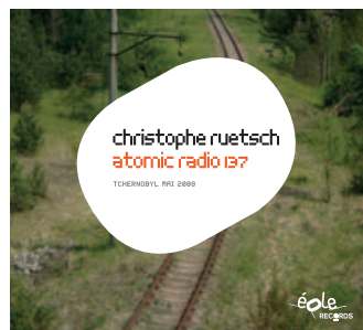
Christophe Ruetsch : atomic radio 137 réf : éOr_003 / sortie mars 2012