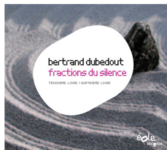
Bertrand Dubedout : fractions du silence réf : éOr_002 / sortie février 2012