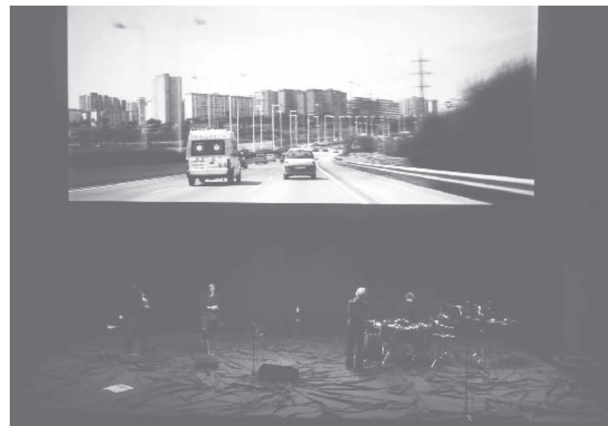
Le Royaume d'en bas